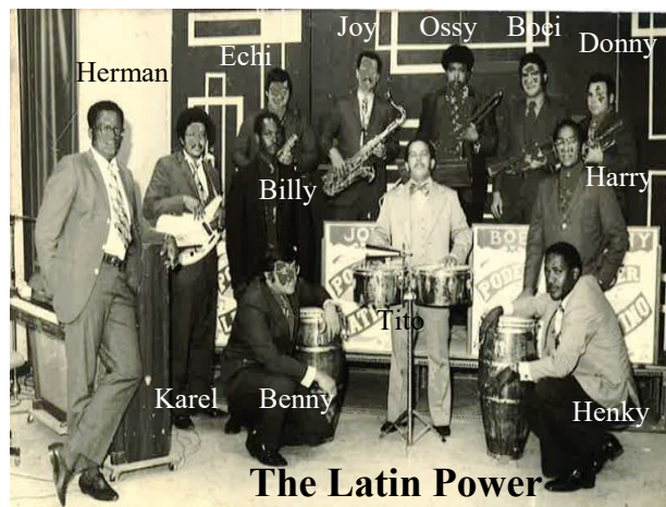
The Latin Power